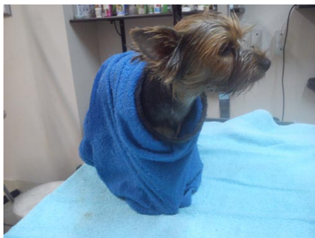
Ryc. 2. Pies po kąpielii, ubrany w wygodny ręcznik

właściwości szamponu. Odżywkę wmasowujemy w sierść, pozostawiamy na 3 minuty, a następnie splukujemy. Ten czas, w którym ma wchłonąć się odżywka, możemy wykorzystać na delikatny masaż pieska, który go zrelaksuje i pobudzi skórę. To ważne, aby kosmetyki pozostawić na psie odpowiednio długo, żeby zdążyły zadziałać w prawidłowy sposób.