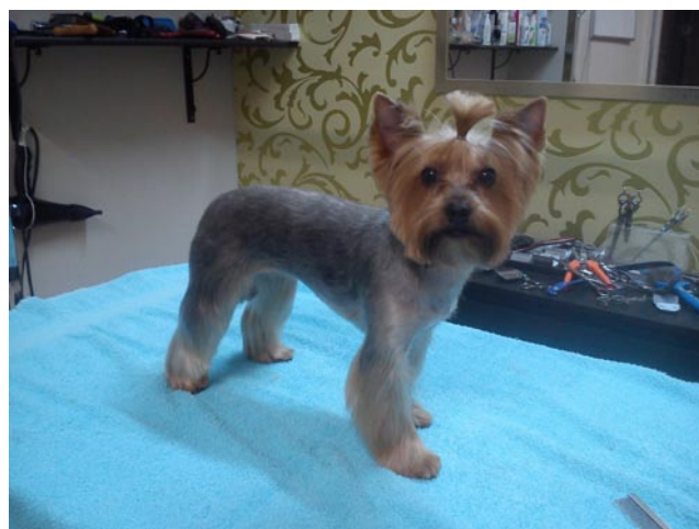
Ryc. 4. Pies po zabiegach pielęgnacyjnych