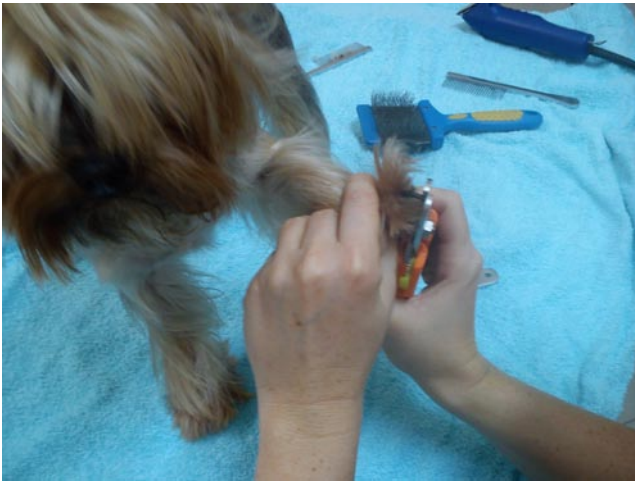
Ryc. 5. Obcinanie pazurków